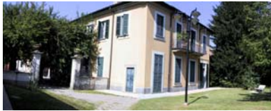
Busto Garolfo, MI

Le capacità tecnico-scientifiche di ICPS nel condurre le attività suesposte sono confermate dai numerosi progetti di ricerca europei, nazionali e regionali nei quali il Centro è stato coinvolto, dalle convenzioni con i Ministeri della Salute e dell'Ambiente per il supporto alle attività di autorizzazione e registrazione dei prodotti fitosanitari in Europa e in Italia, e dal ruolo svolto da personale dell'ICPS come componente di commissioni e comitati dell'Organizzazione Mondiale della Sanità ( Joint FAO/WHO Meeting on Pesticide Residues e altri), dell'Unione Europea ( European Food Safety Authority , DG SANCO, EMA), e del Ministero della Salute (Commissione Consultiva per i Prodotti Fitosanitari, Commissione Consultiva per i Farmaci Veterinari).